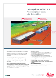
Leica Cyclone MODEL